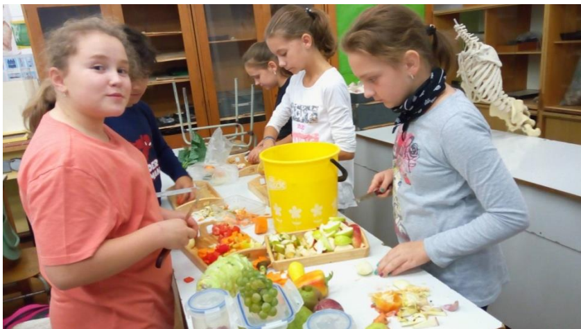
Takto sme pre spolužiakov nachystali vitamínovú bombu!!!