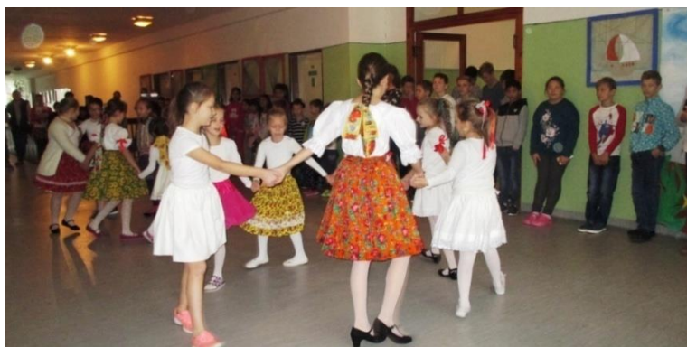
Na chodbe sme zakrepčili.